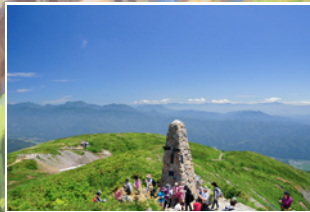
1 八方ケルンから見渡す360°の山並