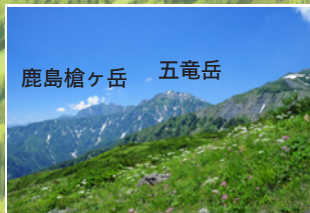
2 迫力の北アルプスの後線