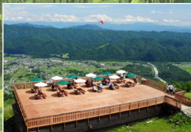
5 天空に浮かぶオープンテラス