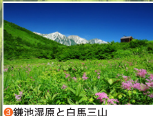
3 鎌池湿原と白馬三山